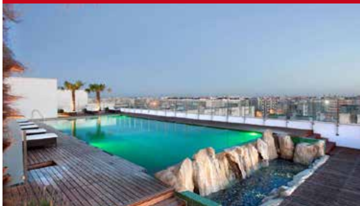
Hilton Garden Inn