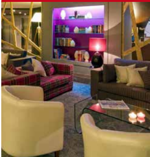
Estrela de Fátima