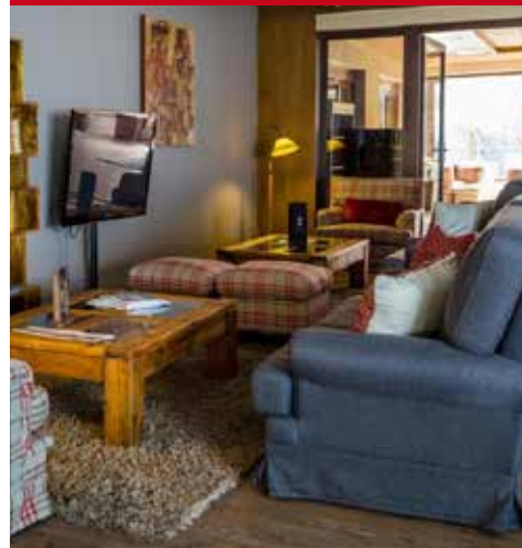
Puralã - Wool Valley