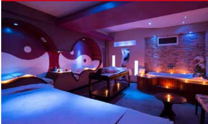
Hotel Lycus River