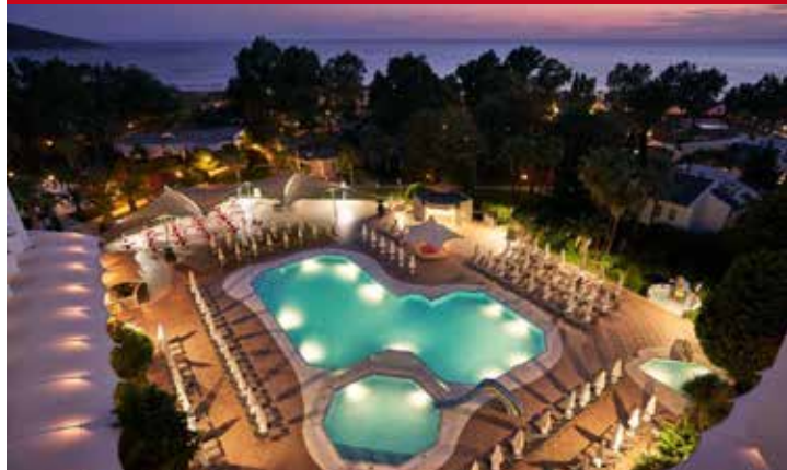
Hotel Richmond Ephesus